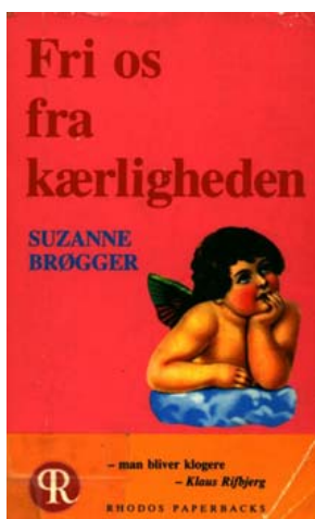
Kvindesagens klassikere 3 indeholdt også en forelæsning om Suzanne Brøggers " Fri os fra kærligheden " (1973)