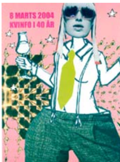
Monique Wernhamm Grafisk design