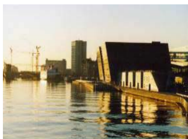
Billede af Fisken og Den Sorte Diamant