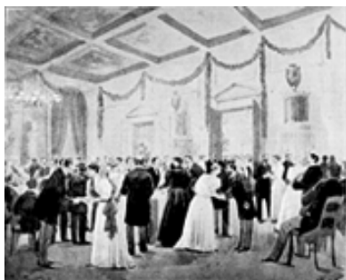
Samtidig tegning fra Kvindernes Udstilling i Odd Fellow Palæet i 1895.

I 2004 satte den københavnske kulturfestival, Golden Days, fokus på København i 1890'erne. KVINFOs bidrag var et eftermiddagsarrangement i Odd Fellow Palæet søndag d. 26. september, hvor der var fokus på samtidens gigantiske succes: Kvindernes Udstilling i 1895.