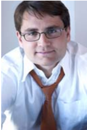
Kulturminister Brian Mikkelsen