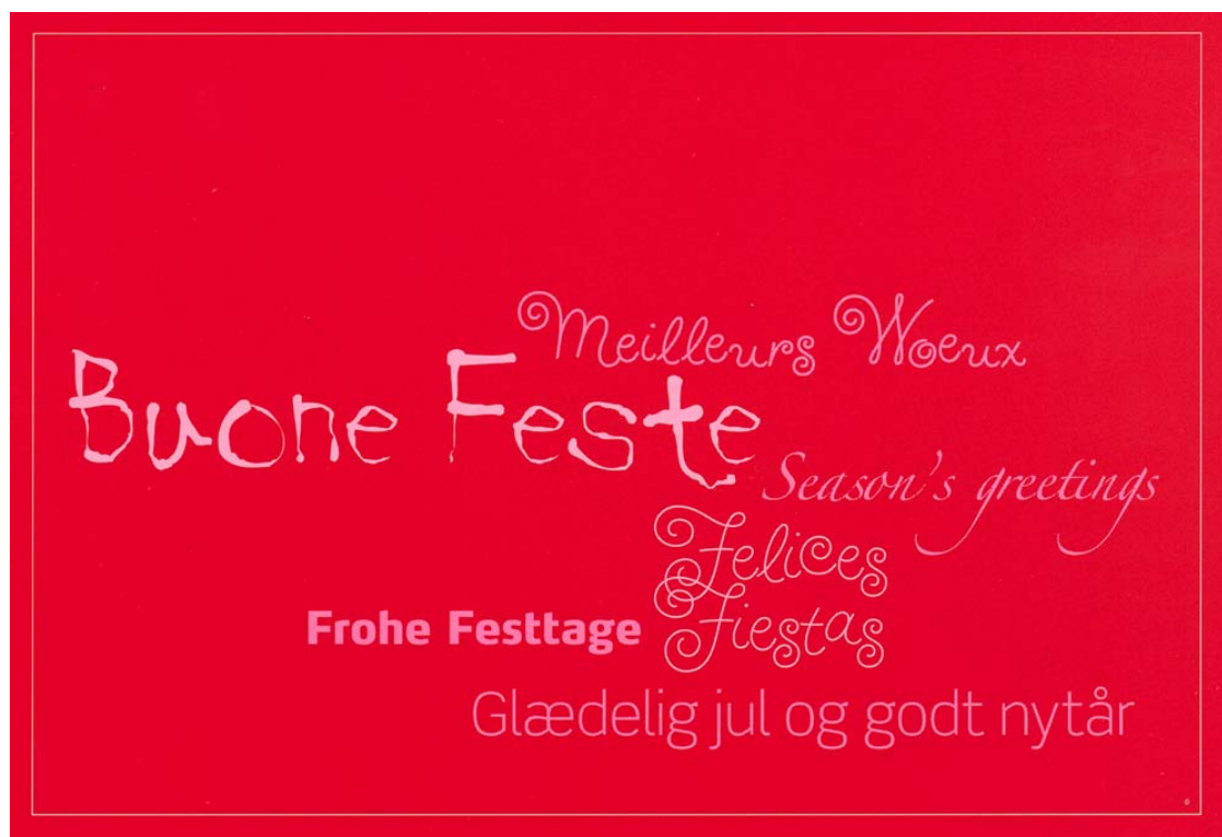
Omslag KVINFOs nytårskort 2004