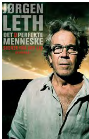
Det uperfekte menneske af Jørgen Leth Gyldendal 2005

....og når man som hun vil mene, at en libertiner ikke kan være honorær konsul på Haiti, må det være tilladt at spørge, hvordan Kulturministeriet kan have en type som Møller Jensen ansat som leder af en af departementets institutioner.