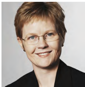
Rikke Hvilshøj, minister for flygtninge, indvandrere og integration