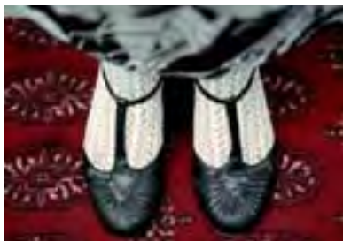
fra Den usynlige succes