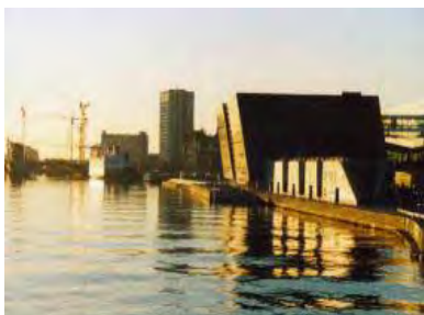
Billede af Fisken og Den Sorte Diamant