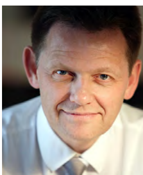
Lars Barfoed, minister for familie- og forbrugeranliggender.