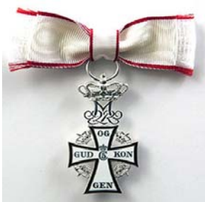
Dannebrogordenen i damesløjfe