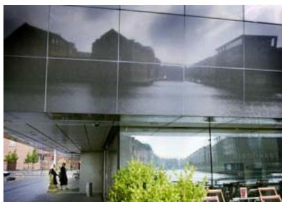
Den Sorte Diamant