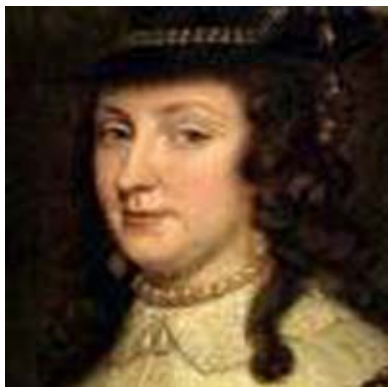
Leonora Christine var blandt renessansens lærde kvinder

Jeg bliver stadig helt høj, når jeg tænker på den fantastiske aften på KVINFO, hvor vil jeg dog ønske, at der kommer flere af den slags. (...) Shahrazads søster er det smukkeste, jeg længe har læst.