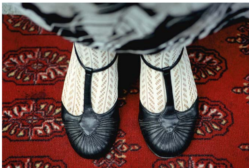
Den usynlige succes

KVINFO Christians Brygge 3 DK-1219 København K