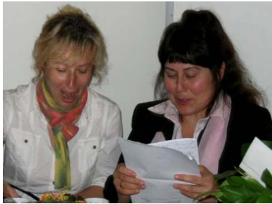
Esbjergkontor ets etårs-fødselsdag blev fejret med reception og sang.