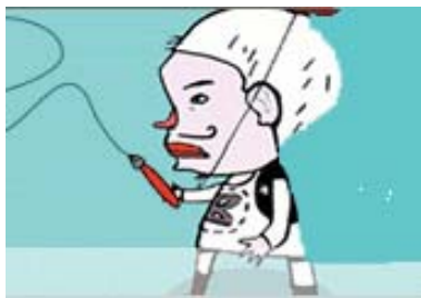
Udsnit af FORUMs nye lay-out

Midt i en medierevolution er historien om KVINFOs kulturtidsskrift »Forum for køn og kultur« lidt af en øjenåbner. En buldrende succes, som tidens mediefeltherrer måske nok kunne lære et og andet af.