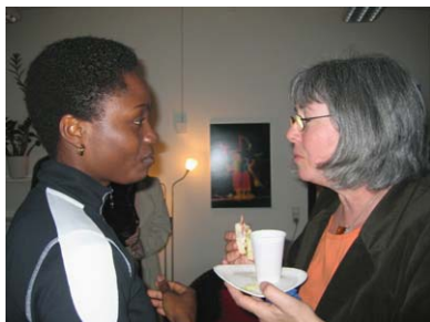
Mentornetværkets Esbjergkontor fyldte et år i april 2006. Udviklingsminister Ulla Tørnæs holdt tale ved receptionen.