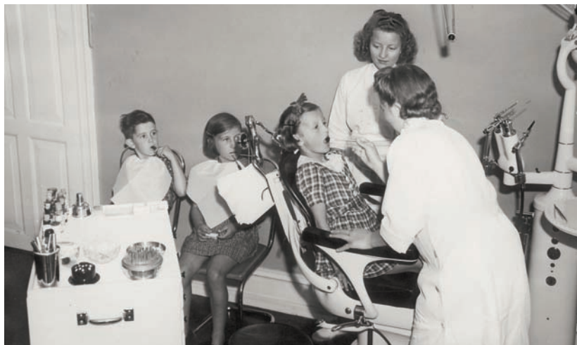
Skoletandlægeklinikken i Esbjerg 1944.

Sammen med kvinderne kom moderne serviceydelser som børnepasning, undervisning og sundhed ind i kommunalpolitikken.